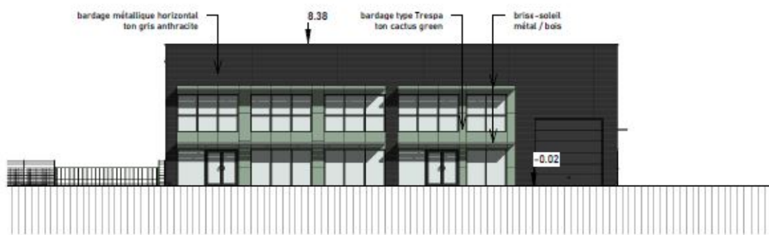
4 Sud 1 : 250