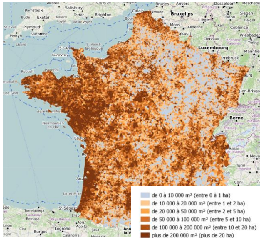
M 2 artificialisés selon la variation de population (2012-2017)